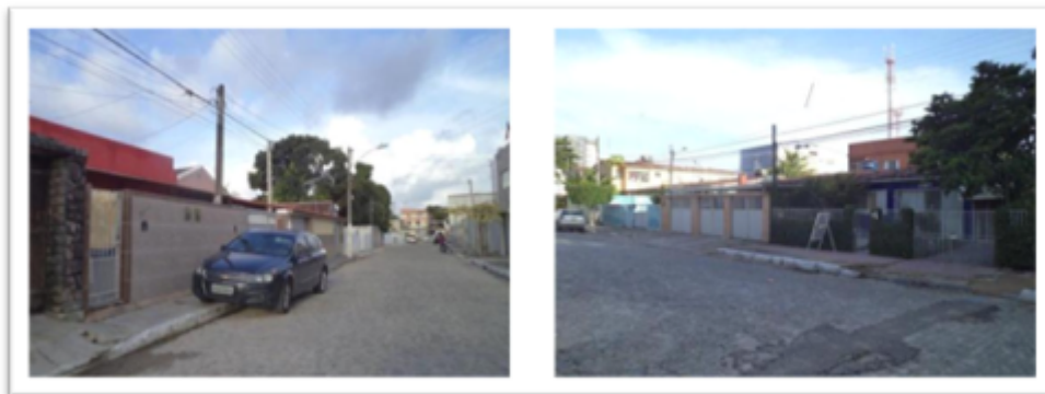
Figura 03 – Caracterização fotográfica dos cluster 1 e 2.

As características visuais levantadas nas inspeções de campo podem ser resumidas em: Baixa agressividade, baixa quantidade de ligações diretas no meio do vão, baixa quantidade de ligações clandestinas e clientes auto religados, pequena parte dos transformadores localizada em áreas de favela (baixa renda).