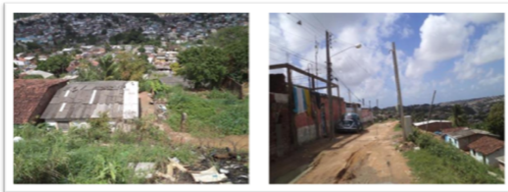
Figura 06 – Caracterização fotográfica do cluster 5.

As ações neste cluster devem ter o seguinte direcionamento: