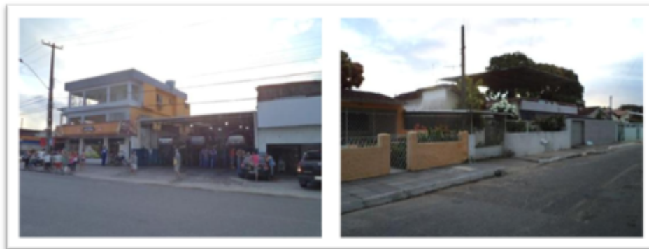
Figura 05 – Caracterização fotográfica do cluster 4.

Extensão de rede nua (360 metros por transformador, em média), baixa presença de unidades consumidoras classificadas como baixa renda (16 por transformador, em média), número de ligações monofásicas (111 por transformador, em média), baixa perda de receita - via informação de Provisão de Devedores Duvidosos (R$ 27.000,00 por transformador, em média), grande número de ocorrências de fraude na classe comercial (6 por transformador, em média), parte da rede de baixa tensão desses transformadores é isolada.