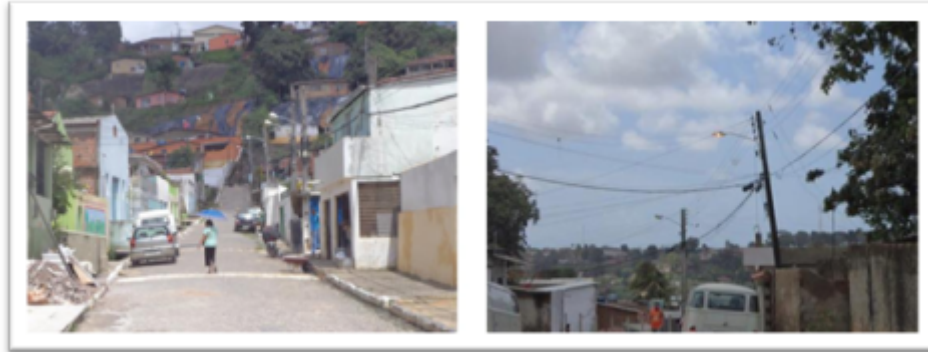
Figura 04 – Caracterização fotográfica do cluster 3.

As características visuais levantadas nas inspeções de campo podem ser resumidas em: Razoável agressividade, razoável quantidade de ligações diretas no meio do vão, razoável quantidade de ligações clandestinas e clientes auto religados, razoável parcela dos transformadores localizada em áreas de favela (baixa renda).