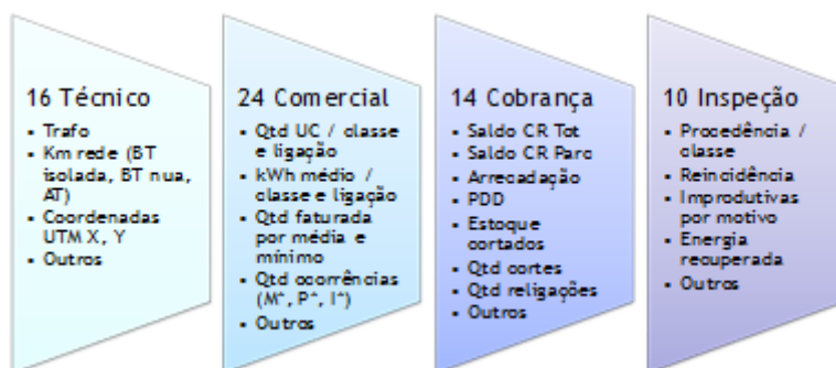
Figura 01 – Parte dos 97 atributos por agrupamento.

Uma vez feita a seleção dos possíveis atributos descritores de ocorrências de fraudes/furtos agrupados em transformadores de distribuição, totalizando 97 atributos , tornou-se fundamental a seleção de um número reduzido que represente, com boa exatidão, as características das áreas atendidas. A técnica adotada neste estudo para redução dos atributos, como mencionado anteriormente, foi a análise fatorial.